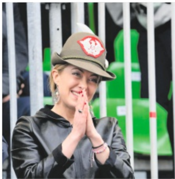
ADUNATA Giorgia Meloni ieri al raduno degli Alpini