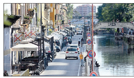
Romanò a pagina 9

● Dopo un mese di collaudo, da oggi attive le telecamere della Ztl in via Ascanio Sforza. Due i varchi: in via Scoglio di Quarto e via Pavia. La Ztl è attiva dalle ore 19 alle 6. E nel weekend dalle ore 19 del venerdì fino alle ore 6 del lunedì.