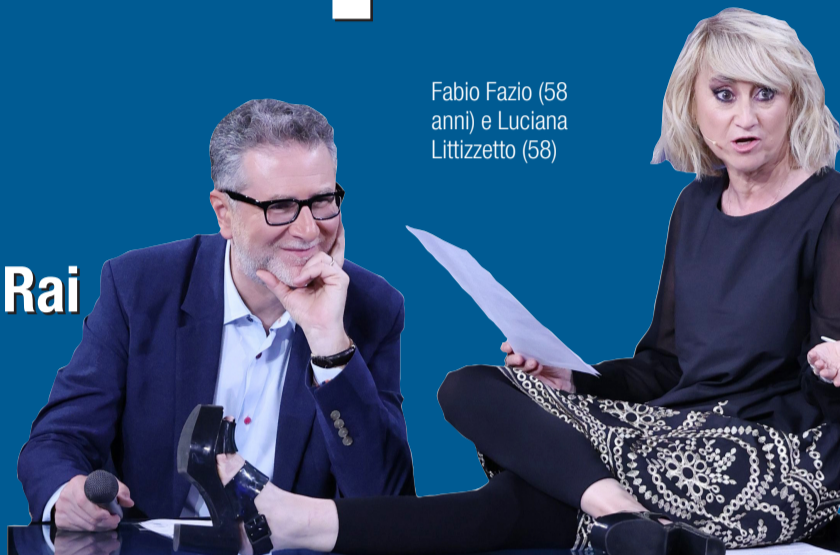
Fabio Fazio (58 anni) e Luciana Littizzetto (58)