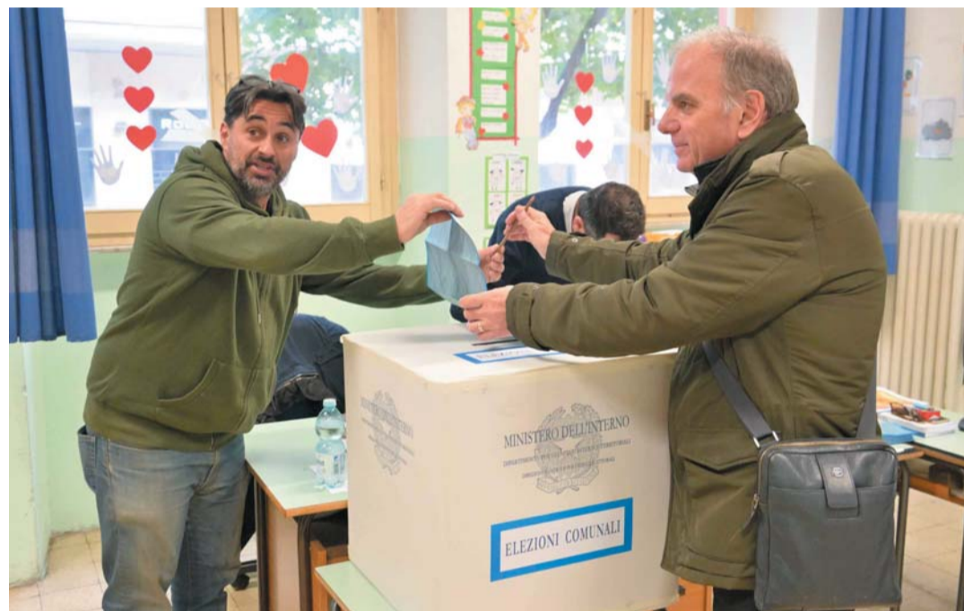
Per i nuovi sindaci Ultima mezza giornata di voto anche in sette comuni umbri. Sopra un seggio di Terni → a pagina 4