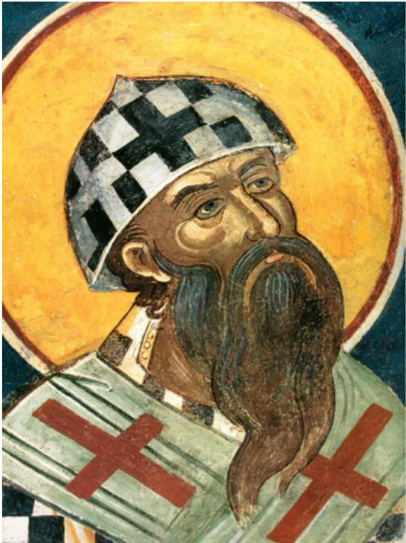
አባ ቄርሎስ ዘእስክንድርያ

አብቲ ዘመን እቲ፡ ብፍላይ ድማ “እቲ ዓምዲ ንስጥሮስ እተባህለ፡ እምነት” ኢልና እንጠቕሶ ጳጳስ ዘቁስጥንጥንያ፡ ኣቦ እዩ። ንእምነቱ ንምሥጢረ ሥጋዌ ዝነበሮ ብርቱዕ ቅንኢ፡ ብዝምልከት፡ ሓደ ሓድሽ ምግላጽ ይምህር ነበረ። ብመሠረት ንስጥሮሳዊ ትምህርቲ፡ ክርስቶስ ክልተ ባሕርይ እዩ ዘለዎ። እቲ ሓደ፡ ሰማያዊን ልዕሊ ዓቕሚ ሰብ ዝኾነን ባሕርይ፡ እቲ ካልኣይ ድማ፡ ኩሉ እቲ ኣብ ባሕርያት ሥጋ ዚርኣ፡ ዜንጸባርቕ፡ ምድራዊ ባሕርይ እዩ። እቲ ሰማያዊ ክርስቶስ፡ ኪሳቕ ወይ ኪመውት ኣይክእልን እዩ። እቲ ሰብ ዝኾነ ክርስቶስ ጥራይ እዩ ተሳቕዩን ሞይቱን፡ ዝብል ትምህርቲ ድማ ነበረ። አባ ቄርሎስ ቀዳማዊ መበል 24 ጳጳስ ዘእስክንድርያ፡ “እቲ ተባዕኣንበሳ” “እቲ ድመቕ መብራህቲ” “እቲ ዓቢ” ዝሓዙ መጻሕፍቲ