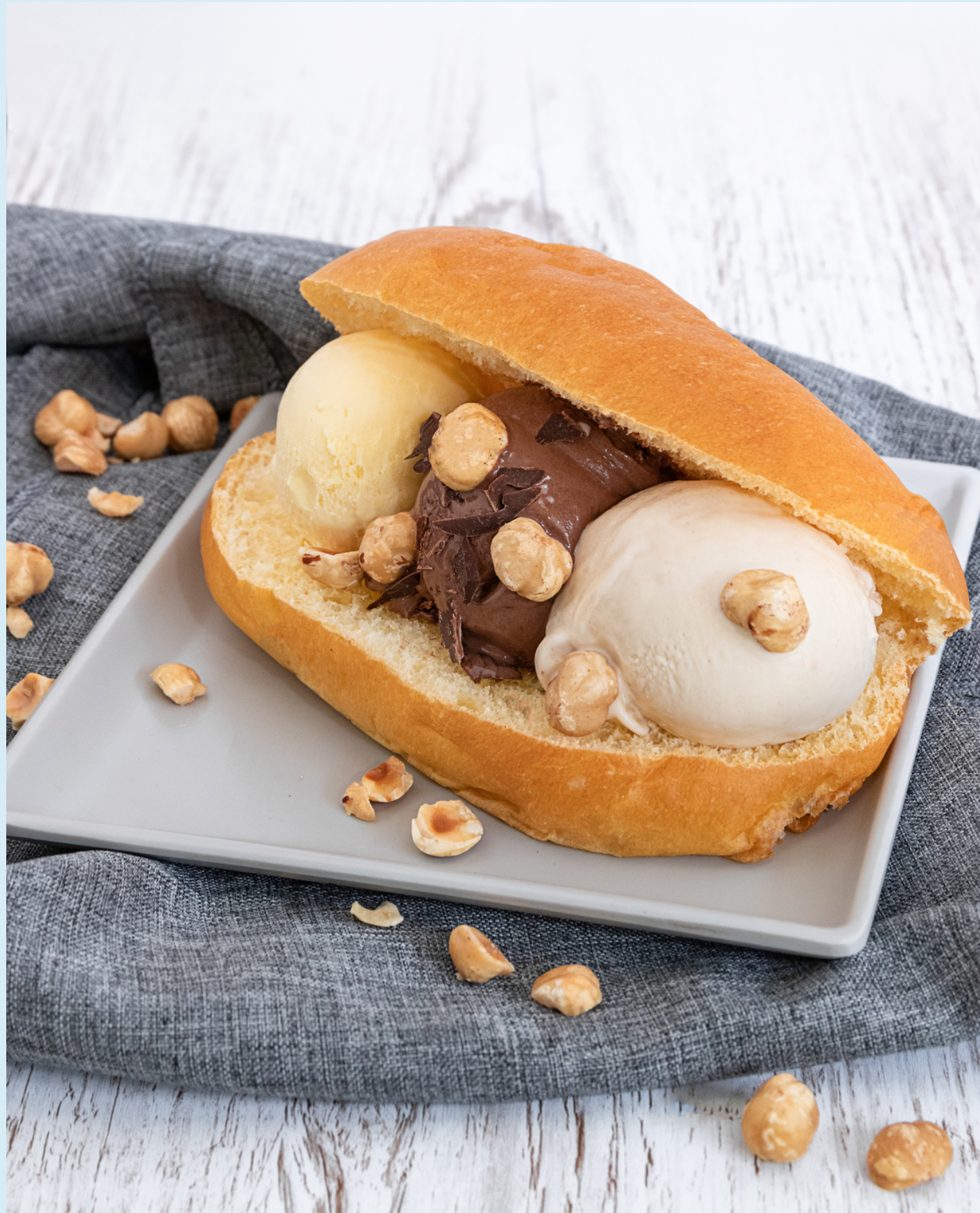
Immagine realizzata per: Tuttogelato, Cattolica

Still life per stampa su cartellonistica. Fondale e allestimento del set personalizzato. Illuminazione omogenea.