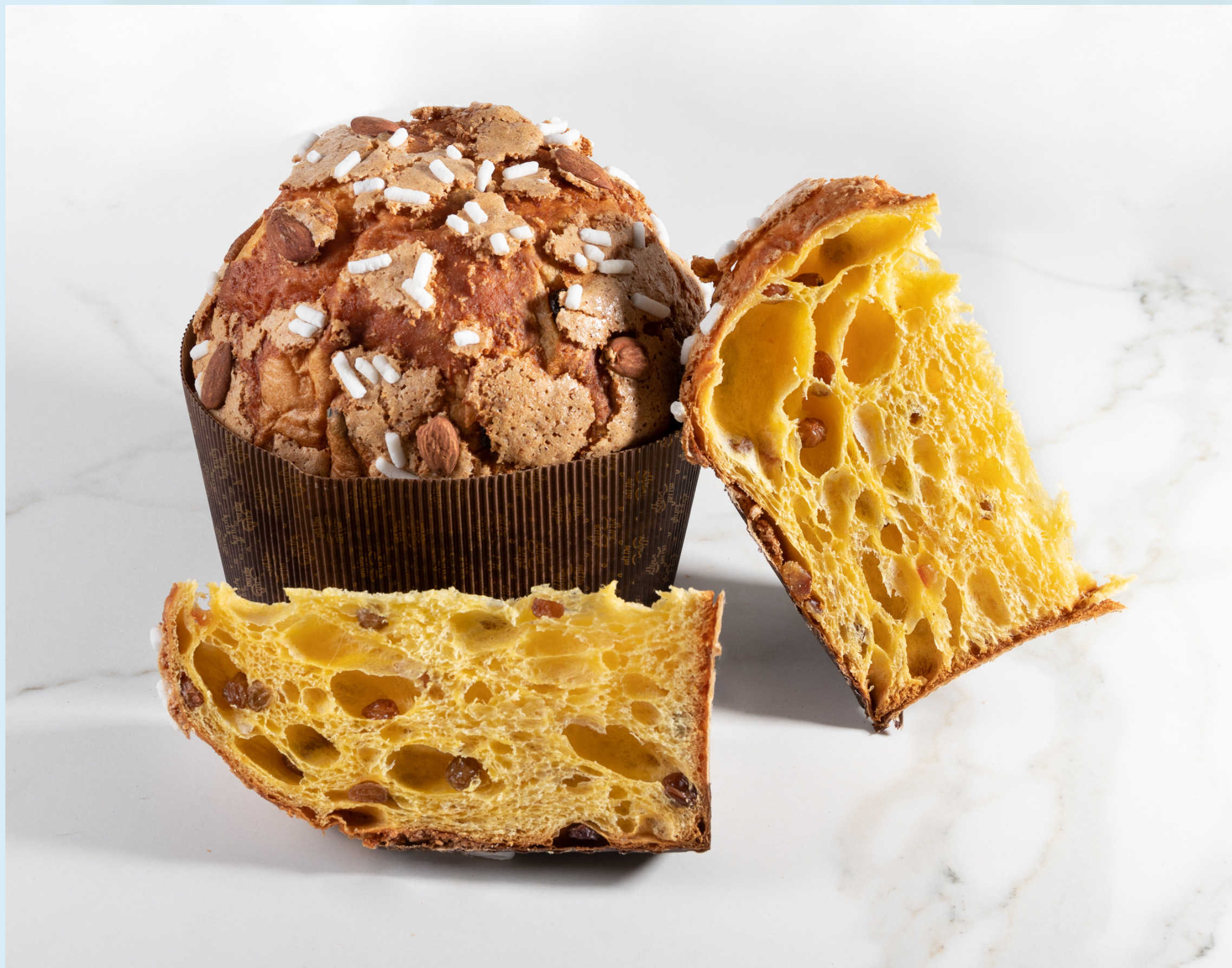
Immagine realizzata per: Alisé Patisserie, Rimini.

Still life per app e social media. Fondale personalizzato. Luce morbida e diffusa, high key.