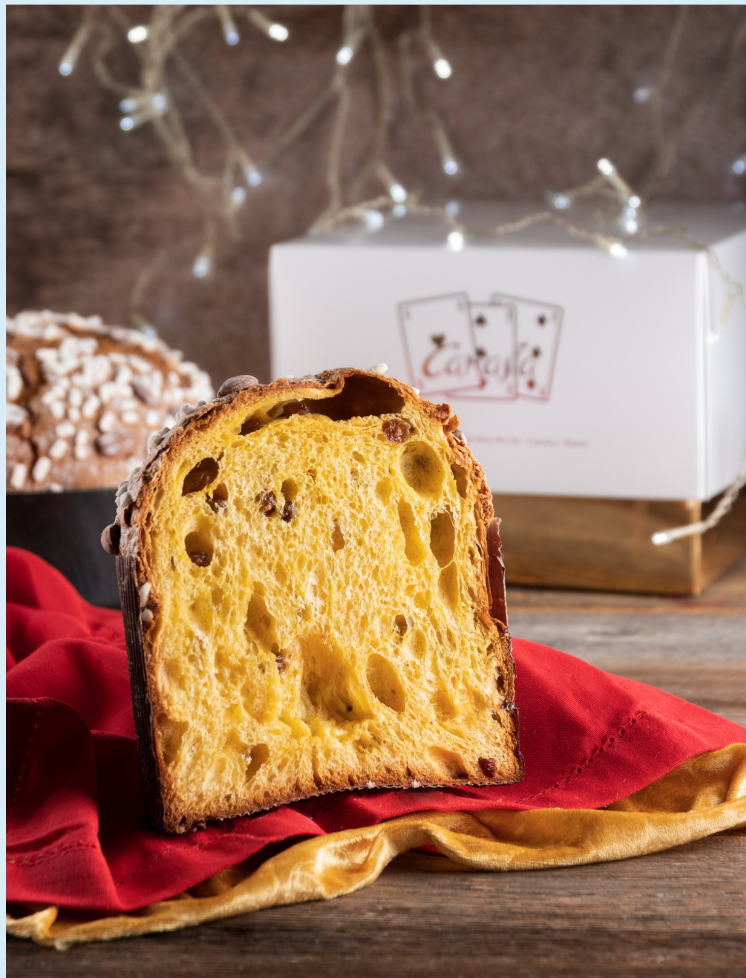
Immagine realizzata per: Pasticceria Canasta, Cattolica

Still life per adv social media. Fondale e allestimento del set personalizzato, coerentemente con i valori e i colori del brand, a partire da immagini di riferimento date.