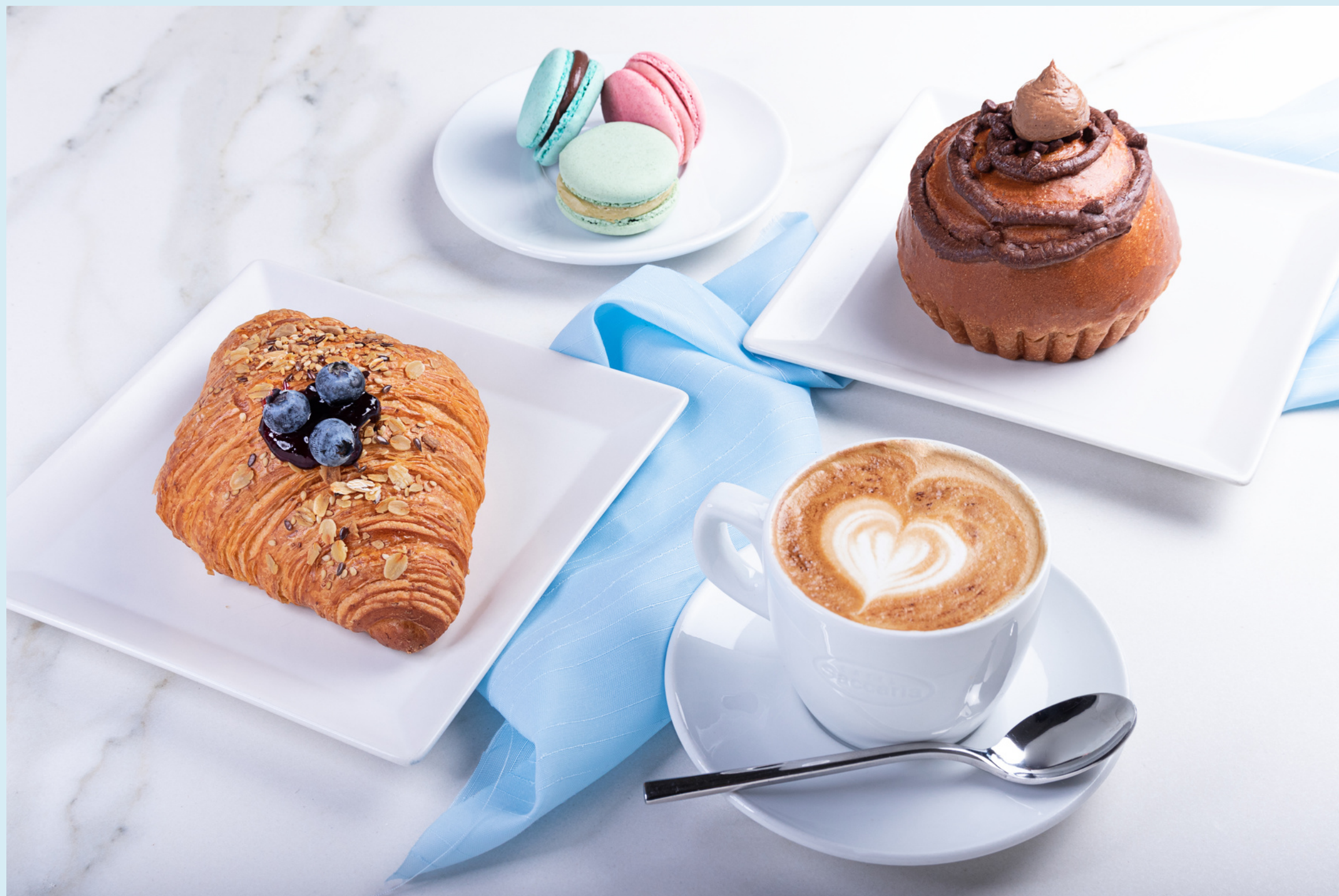
Immagine realizzata per: Alisé Patisserie, Rimini

Still life per social media. Fondale personalizzato. Composizione di prodotti.