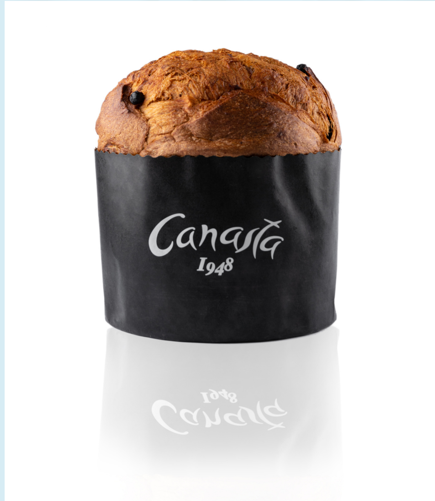
Immagine realizzata per: Pasticceria Canasta, Cattolica

Still life per e-commerce, fondale bianco, effetto specchiato. Luce uniforme.