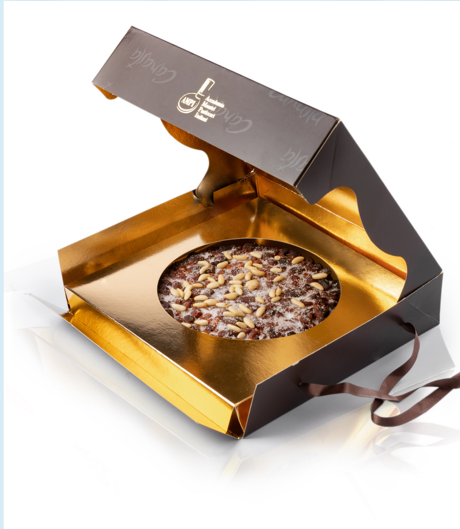
Immagine realizzata per: Pasticceria Canasta, Cattolica

Still life per e-commerce, fondale bianco, prodotto con scatola, effetto specchiato. Luce uniforme.