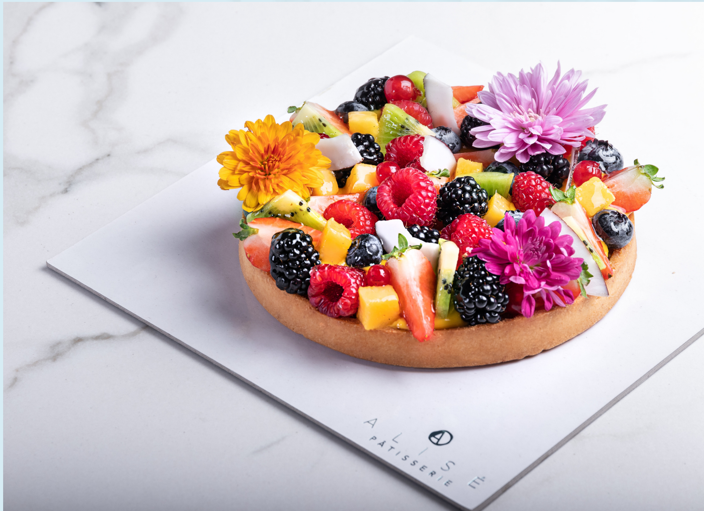
Immagine realizzata per: Alisé Patisserie, Rimini.

Still life per app e social media. Fondale personalizzato. Contrasto morbido.