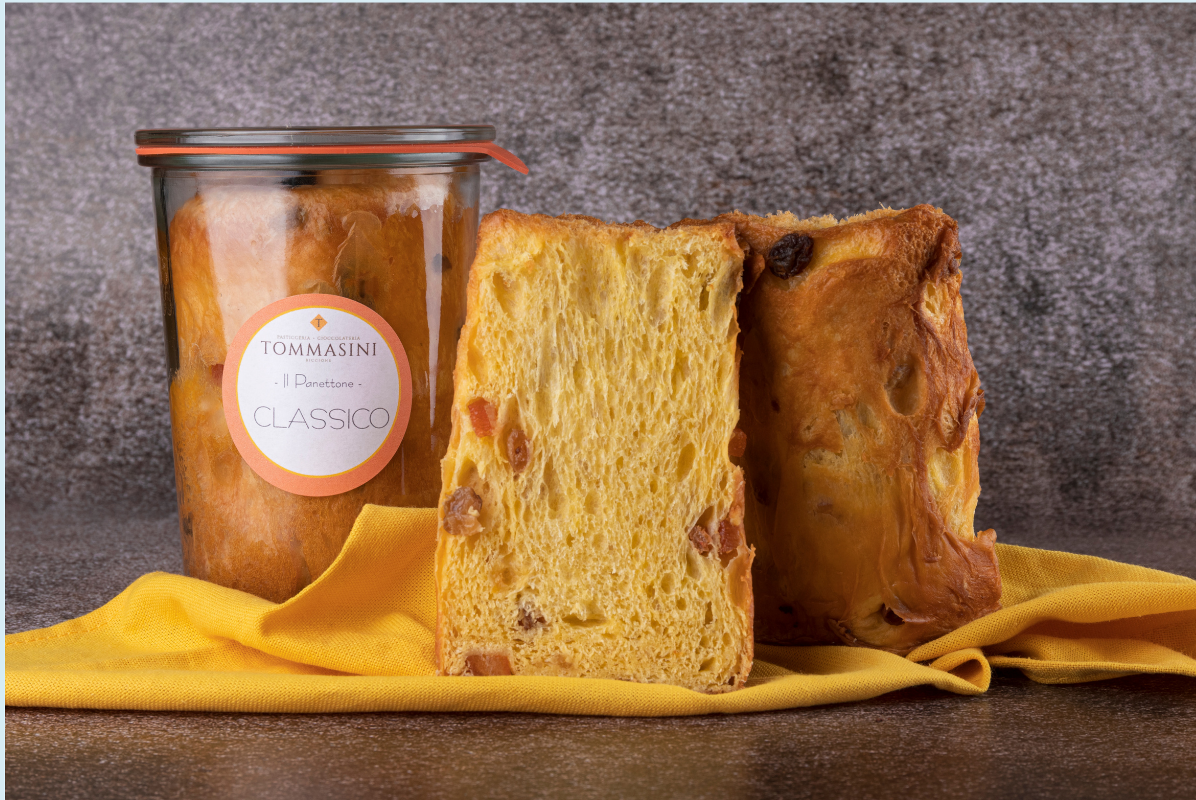
Immagine realizzata per: Pasticceria Tommasini, Riccione.

Still life per adv social. Fondale e allestimento del set personalizzato.