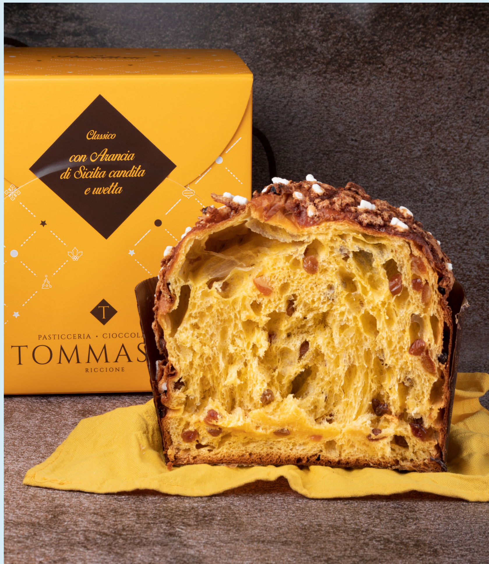
Immagine realizzata per: Pasticceria Tommasini, Riccione.

Still life per app e social media. Fondale e allestimento del set personalizzato. Schema di luci ad alto contrasto.