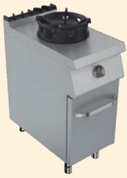
WOK 10 kW UDFC7SAPG 5700.015