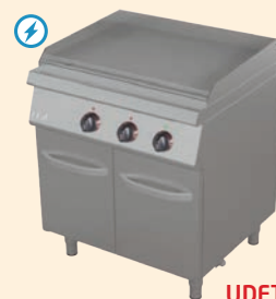
UDFT7DLAPE 5700.032 5700.032C*