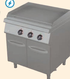
UDFT9DLAPE 5900.032 5900.032C*