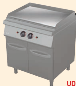
UDFT7DLAPG 5700.030 5700.030C*