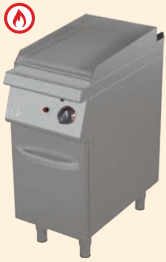
UDFT9SLAPG 5900.021 5900.021C*