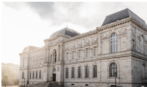
Façade musée Crozatier