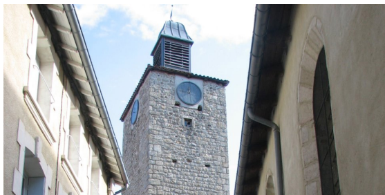
Cloître de Chamalières