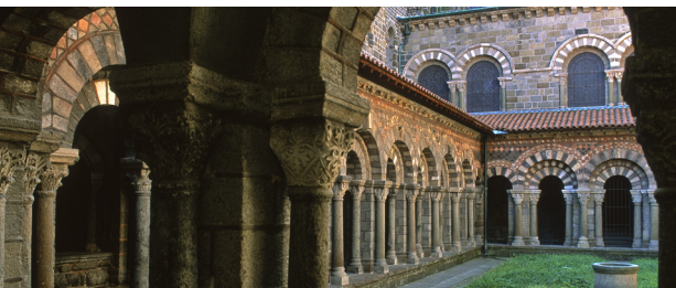
Cathédrale du Puy-en-Velay