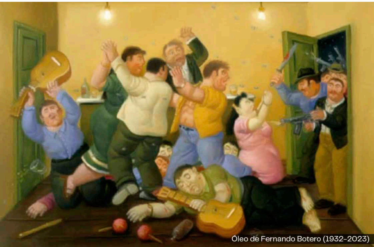
Óleo de Fernando Botero (1932-2023)