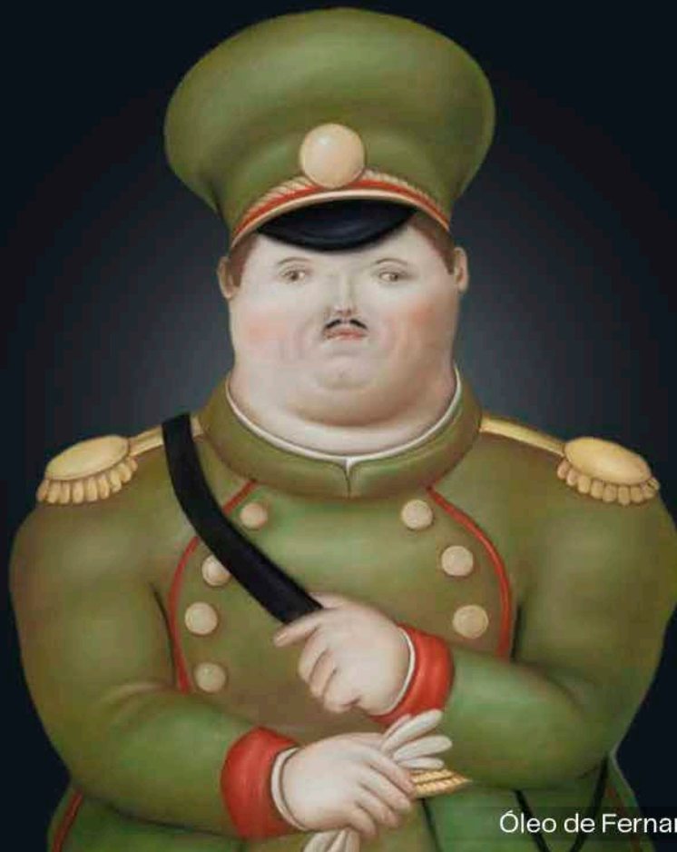
Óleo de Fernando Botero (1932-2023)