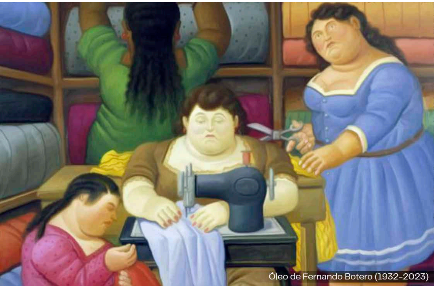
Óleo de Fernando Botero (1932-2023)