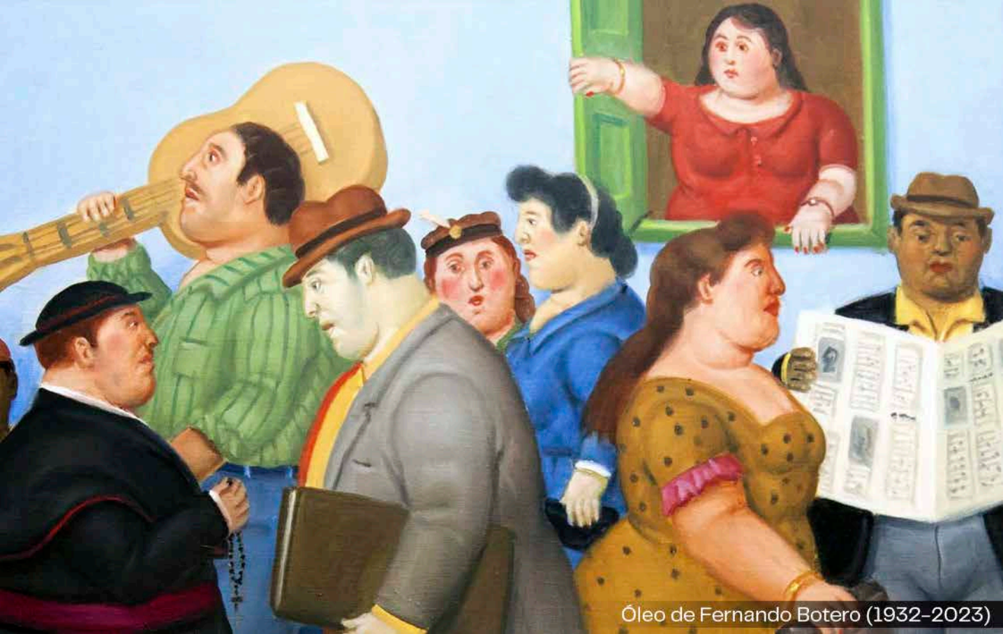
Óleo de Fernando Botero (1932-2023)

Según las más recientes cifras de cada 1.000.000 pesos que produce el país, 561.000 pesos están comprometidos con la DE, un pasivo tan oneroso asfixia el PIB y desde luego genera un déficit fiscal insostenible, mucho más si se tiene en cuenta la desaceleración económica que sufre nuestra economía; esto nos obliga a buscar alternativas fiscales que rompan la lógica antifinanciera de la DE, ya que por más que se cubra su costo solo logramos amortizar los intereses corrientes pero la deuda de capital continua intacta.