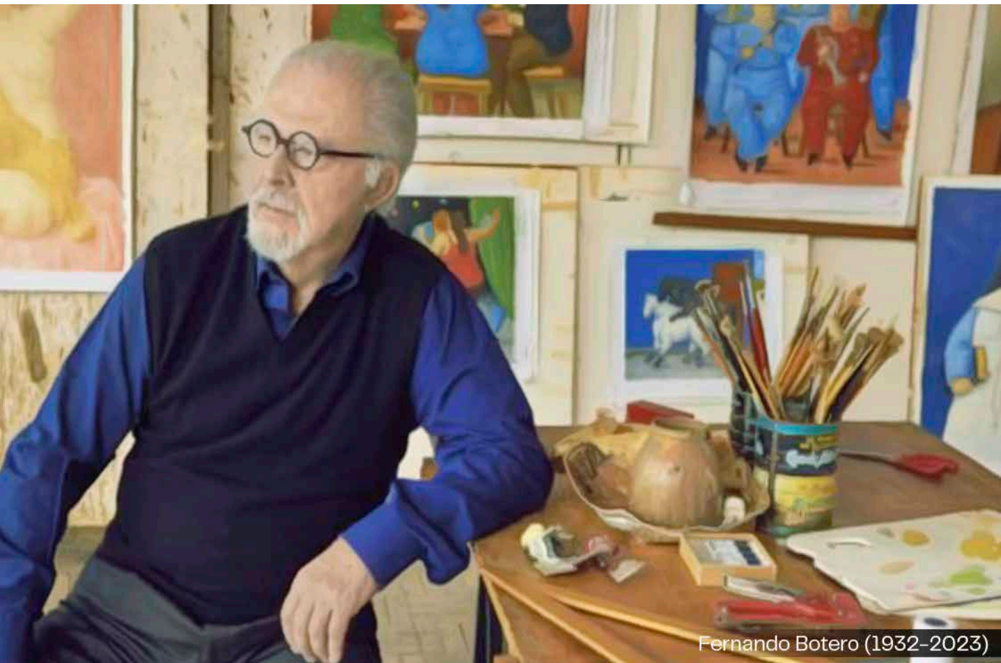
Fernando Botero (1932-2023)

El mundo del arte lamenta el fallecimiento del pintor colombiano #FernandoBotero. Sus creaciones, caracterizadas por la exaltación de formas voluptuosas y su estilo inconfundible, han dejado una marca imborrable en la escena artística internacional.