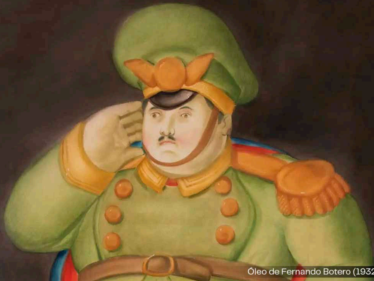
Óleo de Fernando Botero (1932-2023)