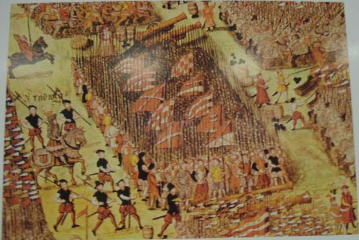
Miniatur aus: J. J. Fugger, Ehrenspiegel... (Handschrift): kroatische Kriegsbanner in der Schlacht von Mohacs 1526

Dva hrvatska stijega s prvim bijelim poljem. Slika pokazuje Mohačku bitku 1526.