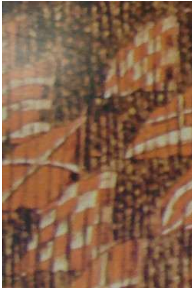
Ukраси kuće u Freiburgu, Njemačka iz 1530.-1532.