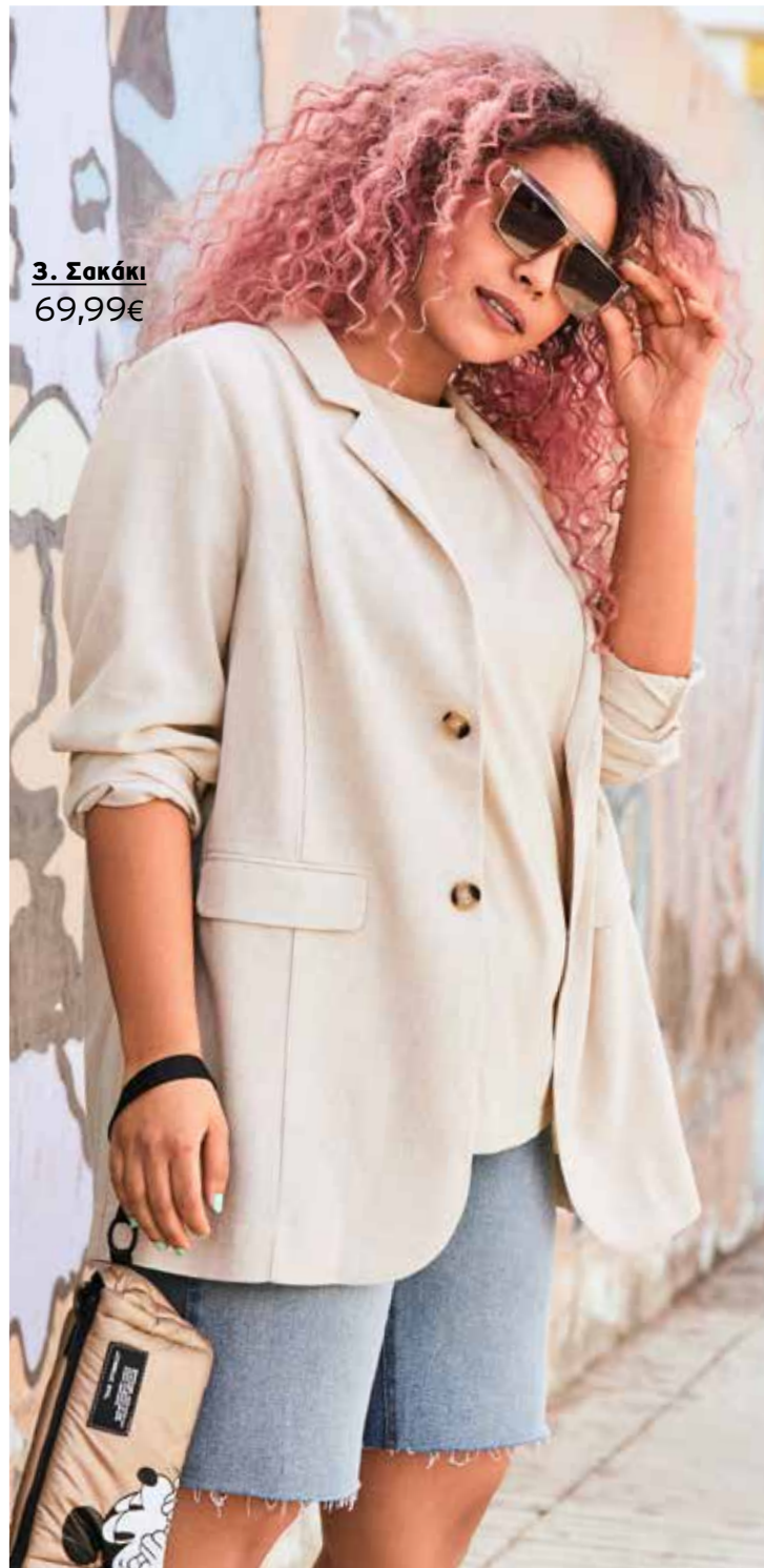
3. Σακάκι 69,99€

2 Τοπ αμάνικο με στρογγυλή λαιμόκοψη, σε ελαφρώς φαρδιά γραμμή. 100% cotton. Πλύσιμο στο πλυντήριο. Μήκος περίπου, προσαρμοσμένο στο μέγεθος: 65 - 73 cm. Μεγέθη: 42/44, 46/48, 50/52, 54/56, 58/60 794 533 150 Μνεζ 19,99€