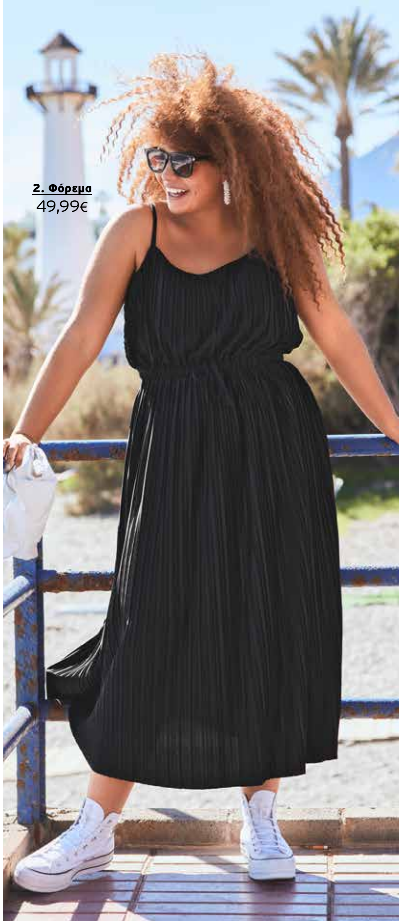
2. Φόρεμα 49,99€