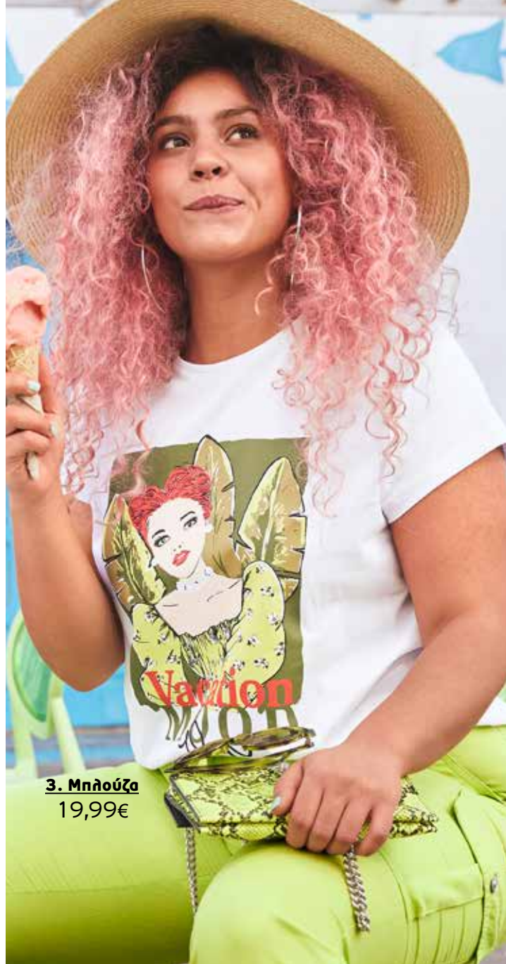
3. Μπλούζα 19,99€

1 Πουκάμισο με alllover τύπωμα, τσέπη στο στήθος και δέσιμο στον ποδόγυρο. 100% viskose. Πλύσιμο στο πλυντήριο. Μήκος περίπου, προσαρμοσμένο στο μέγεθος: 56 - 63 cm.