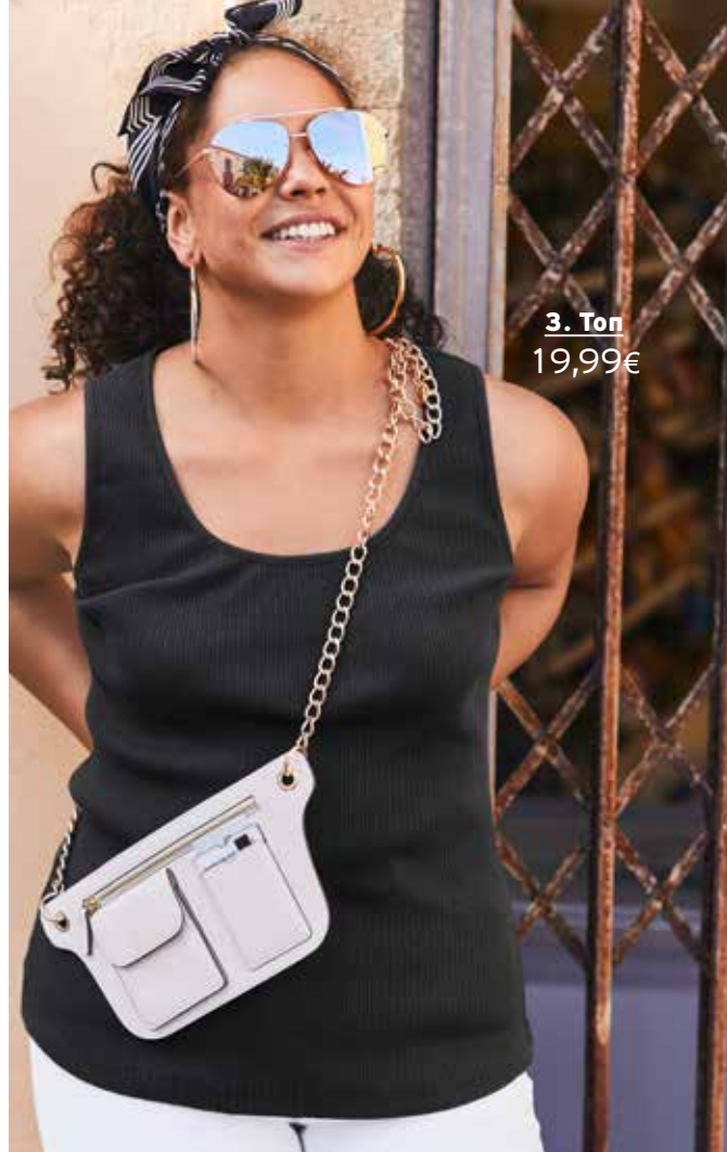
3. Τον 19,99€

1 Μπλούζα σε φαρδιά γραμμή, με V λαιμό και leopard τύπωμα. 100% polyester. Πλύσιμο στο πλυντήριο. Μήκος περίπου, προσαρμοσμένο στο μέγεθος: 74 - 78 cm. Μεγέθη: 42/44, 46/48, 50/52, 54/56, 58/60