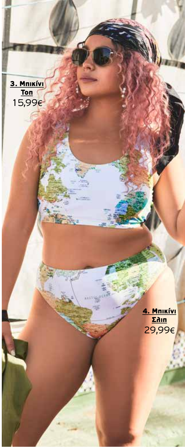
3. Μπικίνι Τοπ 15,99€