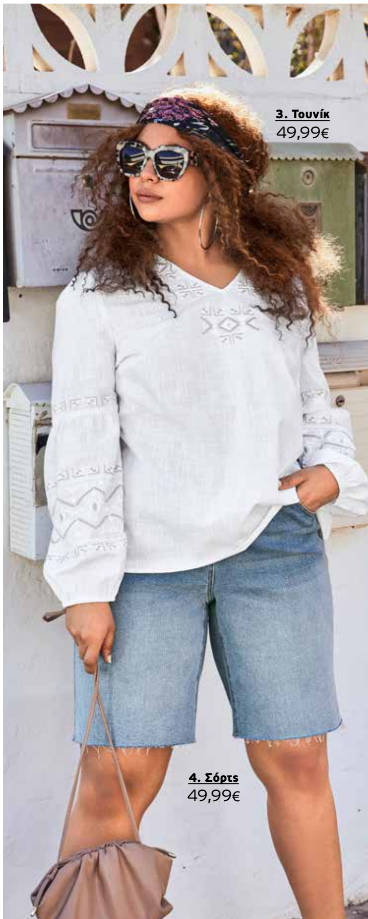
3. Τουνίκ 49,99€