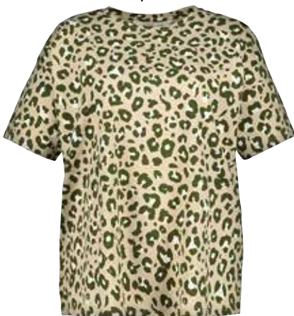
5. Μπλούζα 19,99€

1 Μπλούζα αμάνικη σε φαρδιά γραμμή, με τύπωμα. 100% cotton. Πλύσιμο στο πλυντήριο. Μήκος περίπου, προσαρμοσμένο στο μέγεθος: 65 - 73 cm. Μεγέθη: 42/44, 46/48, 50/52, 54/56, 58/60