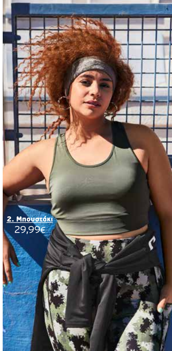
2. Μπουστάκι 29,99€

1 Μπλούζα σε φαρδιά γραμμή, με στρογγυλή λαιμόκοψη, χαμηλωμένους ώμους και κοντά μανίκια. 94% polyester, 6% elasthan. Πλύσιμο στο πλυντήριο. Μήκος περίπου: 69 cm. Μεγέθη: 42/44, 46/48, 50/52, 54/56