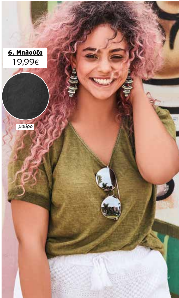
6. Μπλούζα 19,99€