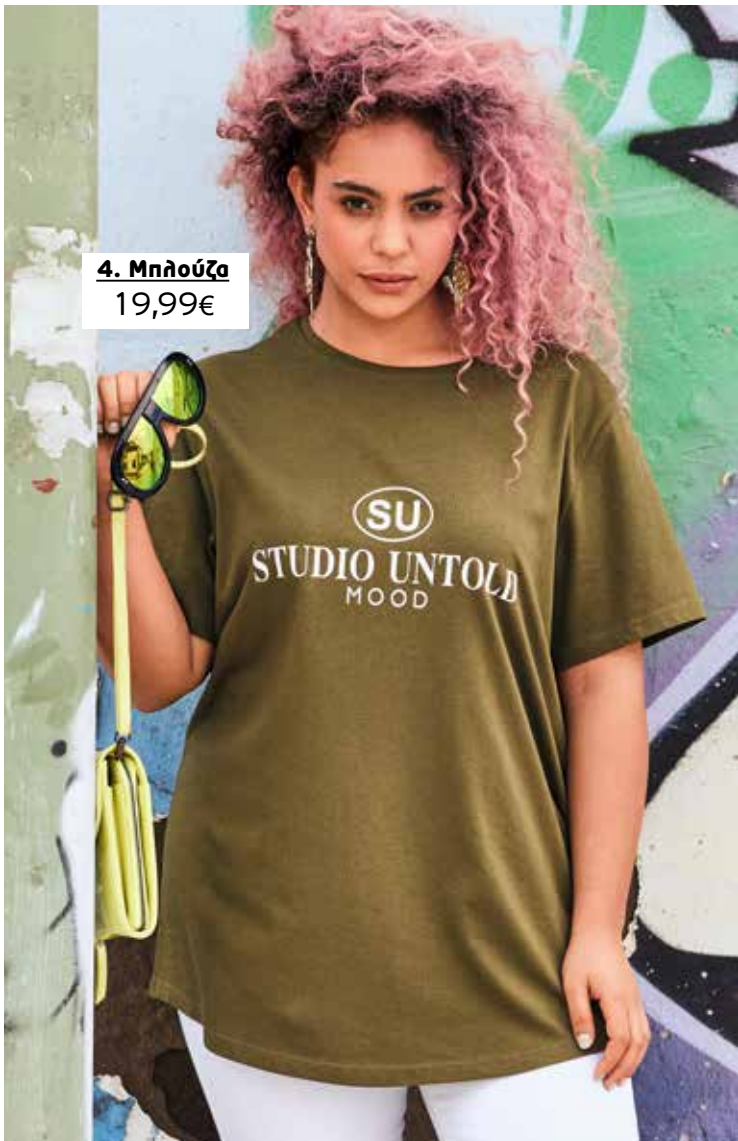
4. Μπλούζα 19,99€