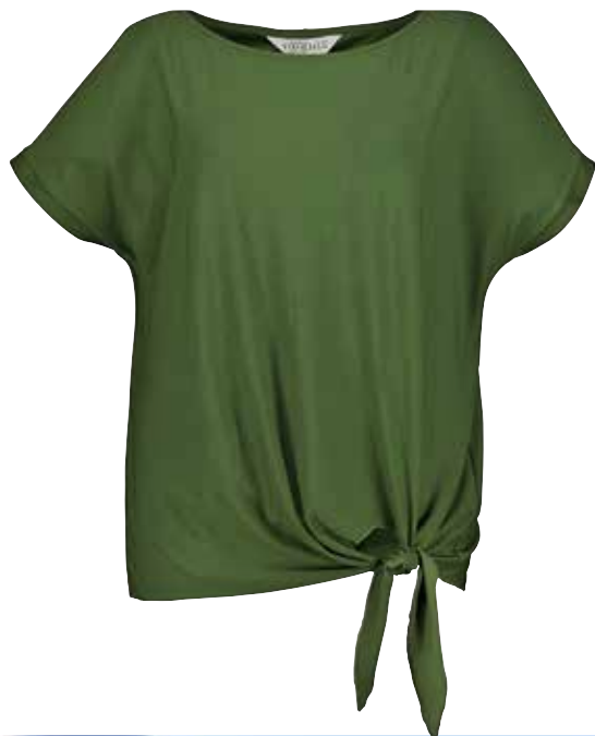
1. Μπλούζα 25,99€