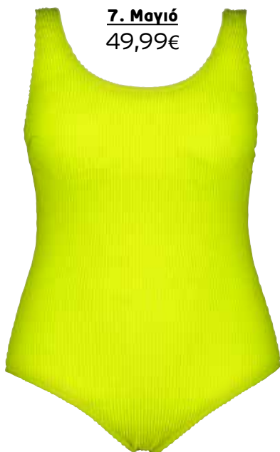
7. Μαγιό 49,99€