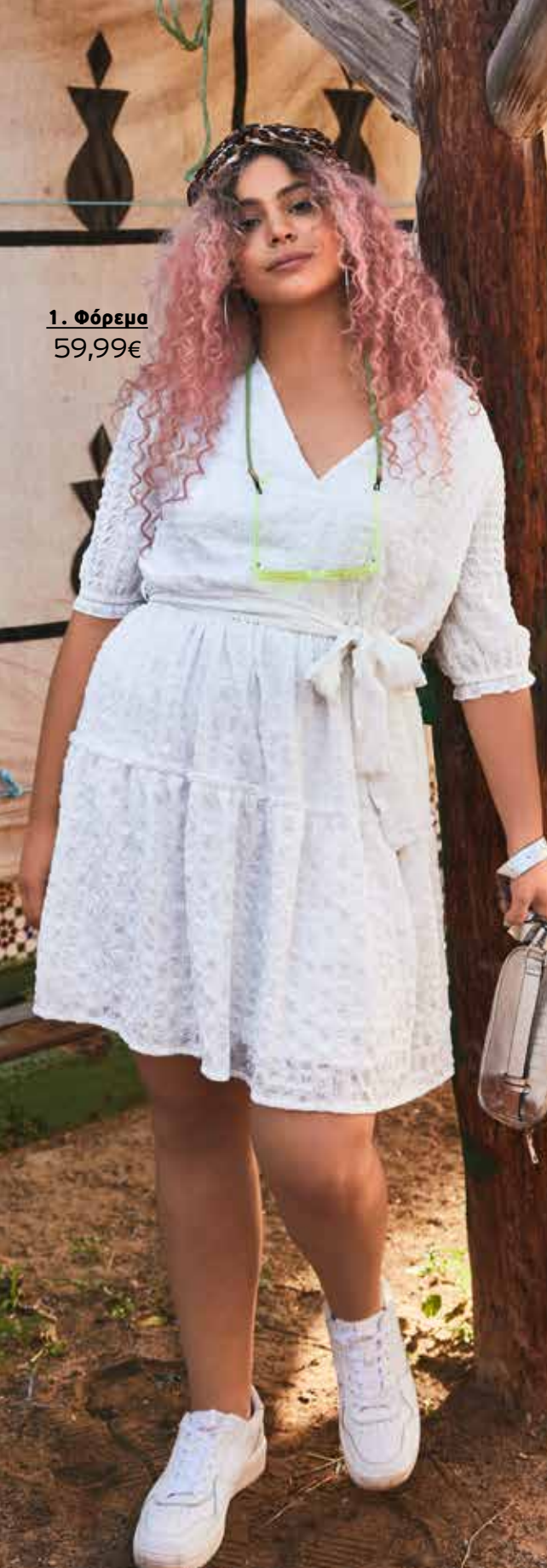
1. Φόρεμα 59,99€