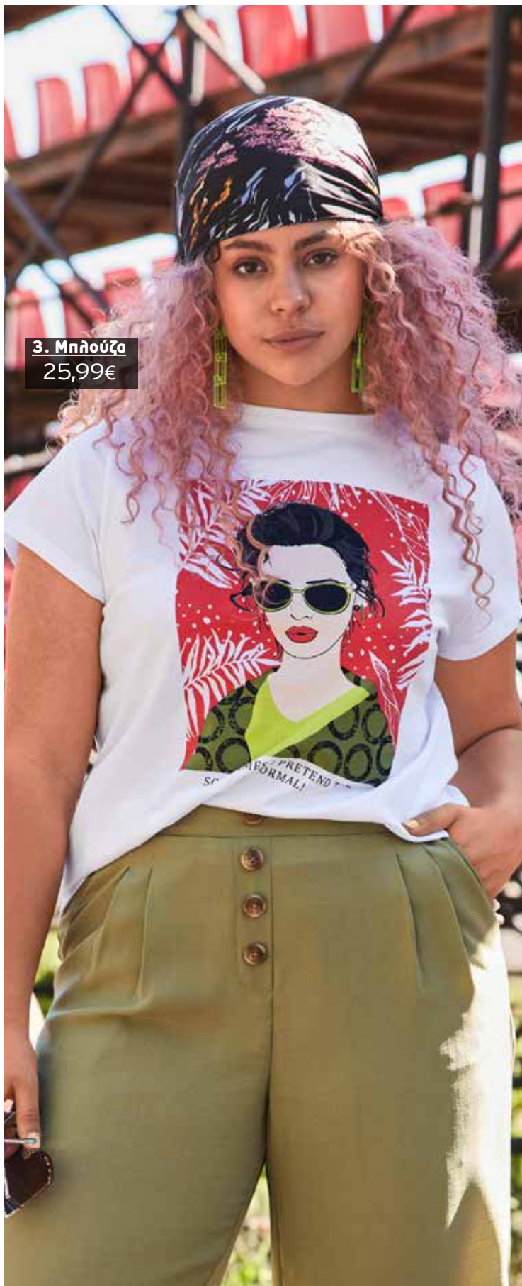
3. Μπλούζα 25,99€