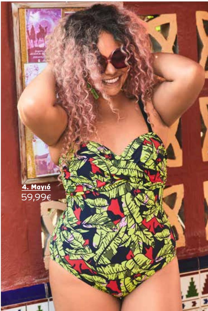
4. Μαγιό 59,99€