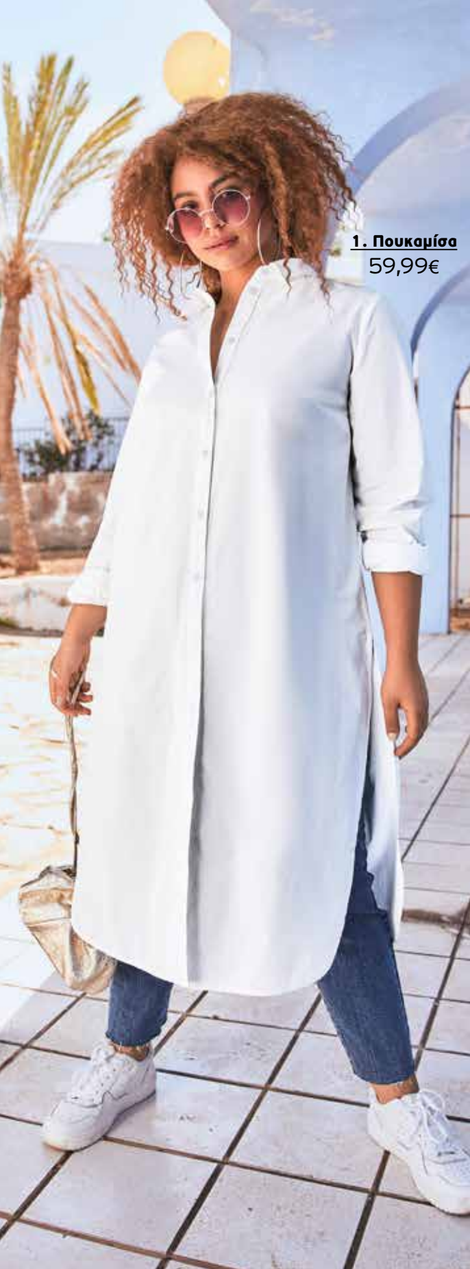
1. Πουκαμίσσα 59,99€