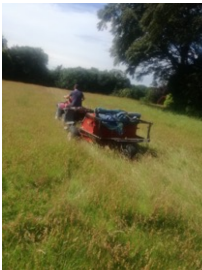
Y cynaeafwr hadau â brwsh ar waith