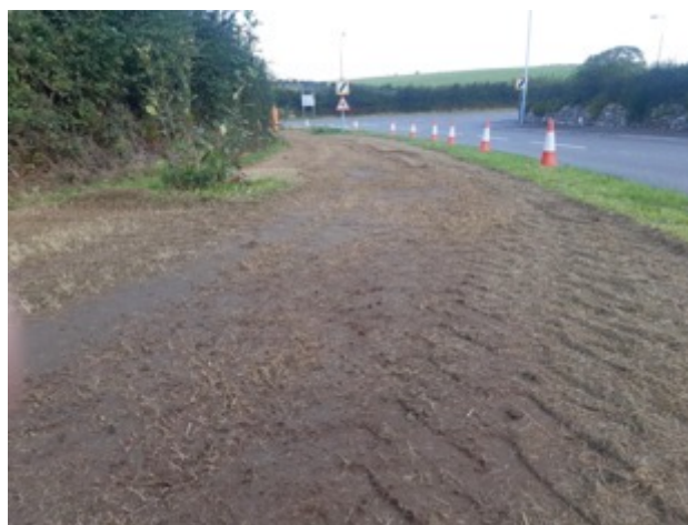
Un o'r peiriannau torri a chasglu Rytech newydd, ac ochr ffordd wedi ei baratoi ar gyfer ei hau