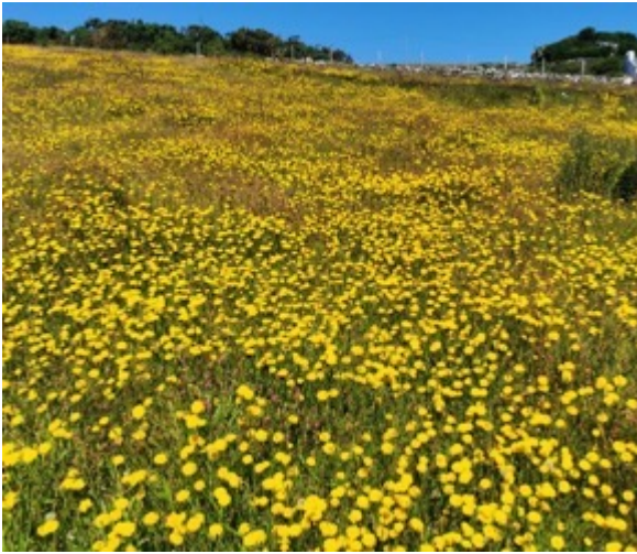
Dôl yn llawn o'r melynydd