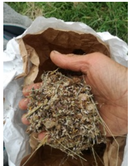
Hadau o ddôl sy'n llawn o'r gribell felen