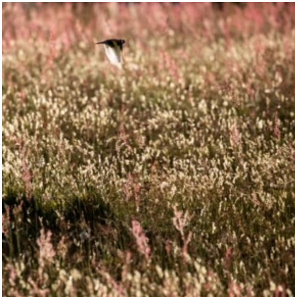
Suran y cŵn