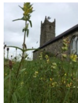
Mynwent Eglwys y Santes Fair