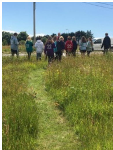
Ysgol Foel Gron