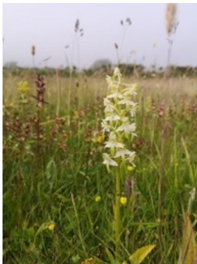
Tegeirian llydanwyrdd yn tyfu ar ddŵl gymunedol Mynytho, a'r bwrdd dehongli a ariennir gan Plantlife