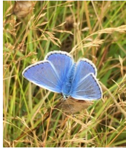
Y glöyn byw y glesyn cyffredin