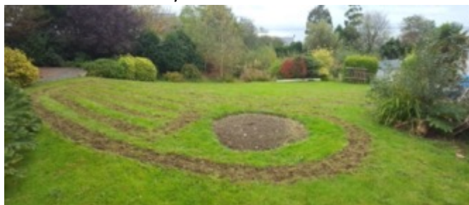
Creu lleiniau moel er mwyn hau'r hadau arny'n nhw