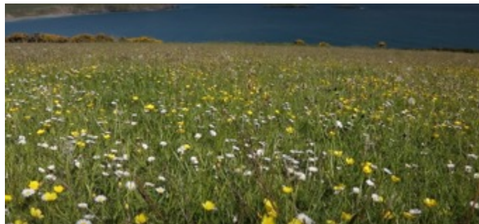
Gwasgaru gwair gwyrdd ar fferm Cwrt yn 2019, a'r un ddôl yn 2022